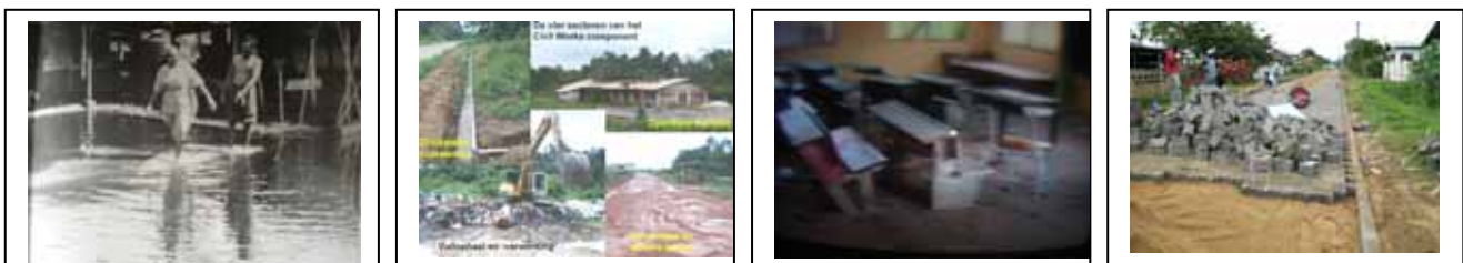
Een eind maken aan ongezonde, verloederde leefomstandigheden en allerhande misstanden via DLGP-II, III, IV...

2.4. Binnen de periode van het thans in uitvoering zijnde DLGP-II wordt er een DLGP-III voorbereid, bestaande uit een Vijfjaar Kapitaalinvesteringsplan 2014-2020 voor de voortzetting van structurele verbetering van de sociaal-economische woon- en leefsituatie in het streven van de Regering om successievelijk en eind te maken aan ongezonde leefomstandigheden en allerhande misstanden in de diverse woongebieden in stad, district en het binnenland.