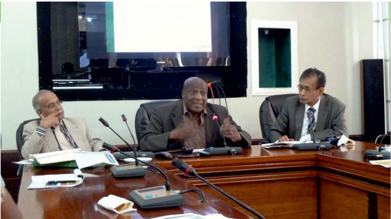
14 april 2011. Leden van het team van staatsadviseurs. Vlnr: Errol Alibux, Jules Wijdenbosch en minister Soewarto Moestadja van Binnenlandse Zaken. April 14 th 2011. Members of the State Advisory team. From left to right: Errol Alibux, Jules Wijdenbosch, and Minister Soewarto Moestadja of Internal Affairs.